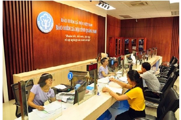
Người dân giải quyết hồ sơ tại BHXH tỉnh Quảng Nam.

tỉnh và 18/18 bộ phận TN&TKQTHC tại BHXH huyện, thị xã, thành phố nhằm phục vụ tốt cho tổ chức, doanh nghiệp, cá nhân trong việc tham gia và giải quyết hưởng các quyền lợi về BHXH, BHYT, BHTN theo quy định của pháp luật.