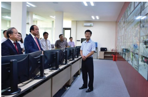
Trung tâm Giám sát, điều hành đô thị thông minh của tỉnh Thừa Thiên Huế vừa được nhận giải thưởng Viên thông châu Á ở hạng mục dự án Thành phố thông minh sáng tạo nhất châu Á.

nghiêm túc, thường xuyên. Duy trì và tiếp tục nâng cao chất lượng kiểm tra, rà soát, hệ thống hóa văn bản quy phạm pháp luật. Tỉnh Thừa Thiên Huế đã đẩy mạnh cải cách thủ tục hành chính (TTHC) để phục vụ tốt nhất nhu cầu của tổ chức, công dân trên địa bàn. Đặc biệt, với sự hình thành và đưa vào hoạt động của Trung tâm Phục vụ hành chính công tỉnh và 9 Trung tâm phục vụ hành chính công các huyện, thị xã, thành phố trên địa bàn tỉnh vào đầu năm 2018, việc tiếp nhận và giải quyết TTHC cho các tổ chức, cá nhân đã có nhiều đột phá, được đồng bào Nhân dân đồng tình ủng hộ.