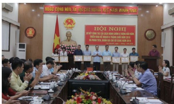
Khen thưởng cho 15 tập thể và 12 cá nhân có thành tích xuất sắc trong công tác CCHC năm 2018