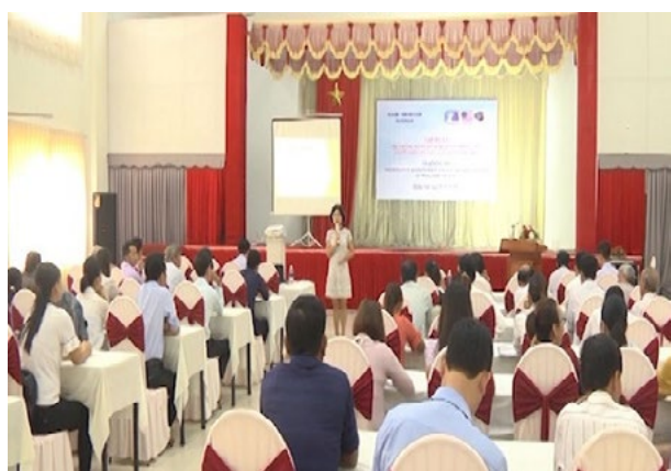
Quang cảnh lớp tập huấn

Sáng 5/8, tại thành phố Tam Kỳ, Cục Bảo trợ Xã hội, Bộ LĐTB&XH phối hợp với UBND tỉnh Quảng Nam tổ chức lớp tập huấn sử dụng hệ thống đăng ký và quản lý thông tin người khuyết tật, nạn nhân bom mìn cho các cán bộ làm công tác xã hội cấp huyện, xã và các đối tượng là người khuyết tật trên địa bàn tỉnh.