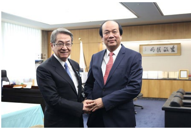
Bộ trưởng, Chủ nhiệm VPCP Mai Tiến Dũng và Bộ trưởng Bộ Nội vụ và Truyền thông Nhật Bản (MIC) Masatoshi Ishida

Chiều 7/8, tại Tokyo, Văn phòng Chính phủ (VPCP), Bộ Nội vụ và Truyền thông Nhật Bản và Văn phòng Nội các Nhật Bản đã ký kết Bản ghi nhớ hợp tác (MOC) về triển khai Chính phủ điện tử tại Việt Nam.