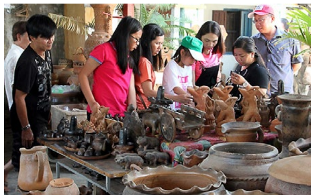
Du khách tham quan làng gốm Bàu Trúc (Ninh Thuận)

Lạt là một trong những thành phố đầu tiên của cả nước xây dựng đề án thành phố thông minh. Về Chỉ số năng lực cạnh tranh cấp tỉnh (PCI), Lâm Đồng đứng thứ 27/63 tỉnh, thành phố trực thuộc Trung ương năm 2018.