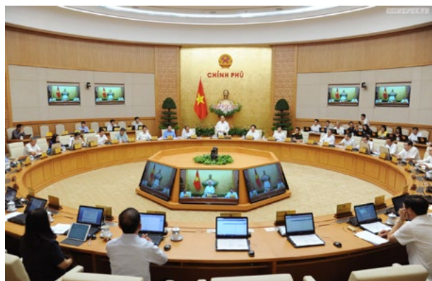
Phiên họp Chính phủ chuyên đề xây dựng pháp luật, ngày 5/8.

Vương Đình Huệ, Trịnh Đình Dũng và nhiều vị “tư lệnh” các ngành giao thông vận tải, tài nguyên và môi trường, công thương, y tế... và đại diện các Ủy ban của Quốc hội đều nhận định tình trạng chông chéo, xung đột pháp luật là vấn đề lớn, cản trở sự phát triển hiện nay.