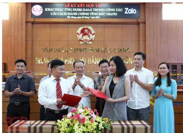
Lễ ký kết hợp tác khai thác ứng dụng Zalo vào cải cách hành chính tỉnh Bắc Giang