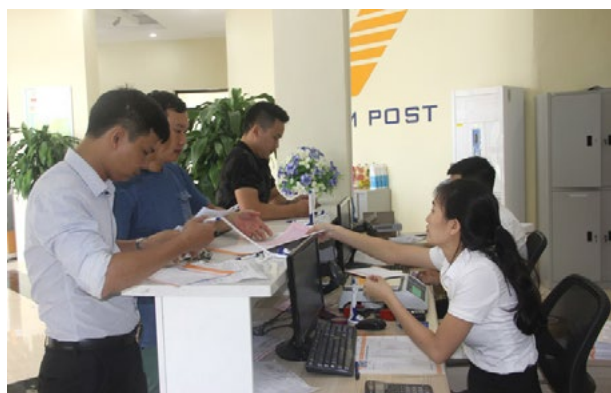
Bưu điện tỉnh Vĩnh Phúc tiếp nhận hồ sơ, trả kết quả giải quyết thủ tục hành chính.

chính tới tay người dân tại địa chỉ theo yêu cầu, góp phần tích cực trong công tác cải cách thủ tục hành chính. Hiện đơn vị đang cung cấp các dịch vụ: Cấp đổi giấy phép lái xe, thu phí xử phạt vi phạm giao thông và chuyển trả giấy tờ tạm giữ, cấp đổi hộ chiếu, chứng minh nhân dân, hồ sơ y tế, phiếu lý lịch tư pháp... 6 tháng đầu năm nay, tổng kinh doanh dịch vụ tiếp nhận, trả kết quả thủ tục hành chính đạt trên 2 tỷ đồng, đạt 89% kế hoạch Tổng Công ty giao. Trong đó, một số bưu điện huyện, thành phố đã ký được thỏa thuận hợp tác với UBND các huyện, thành phố: Phúc Yên, Vĩnh Yên, Yên Lạc và Sông Lô.