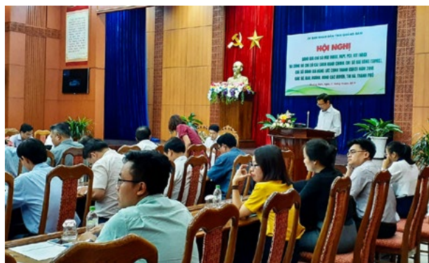
Quang cảnh Hội nghị trực tuyến đánh giá Chỉ số CCHC, Chỉ số năng lực cạnh tranh, Chỉ số hiệu quả quản trị và hành chính công, Chỉ số sẵn sàng cho phát triển và ứng dụng CNTT của tỉnh năm 2018

Đồng thời, UBND tỉnh đã tổ chức Hội nghị trực tuyến đánh giá Chỉ số CCHC, Chỉ số năng lực cạnh tranh, Chỉ số hiệu quả quản trị và hành chính công, Chỉ số sẵn sàng cho phát triển và ứng dụng CNTT của tỉnh năm 2018; Hội nghị tổng kết 10 năm thực hiện Nghị quyết số 09-NQ/TU ngày 05/04/2009 của Tỉnh ủy về xây dựng, cải thiện môi trường đầu tư trên địa bàn tỉnh Quảng Nam; Hội nghị bàn giải pháp khắc phục khắc phục tình trạng trễ hạn trong giải quyết THC thuộc lĩnh vực đất đai trên địa bàn tỉnh; Hội nghị đối thoại, tháo gỡ khó khăn cho doanh nghiệp.