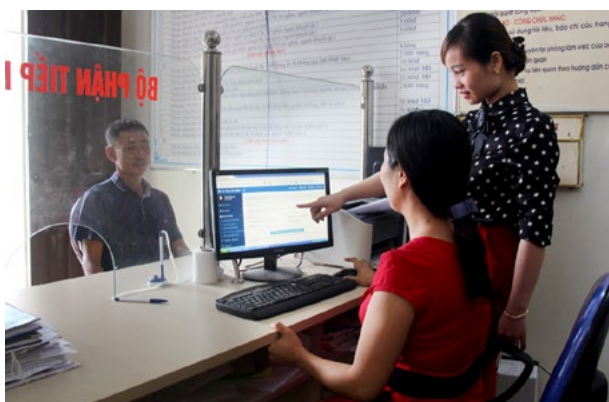
Cán bộ xã Võ Lao tích cực triển khai thực hiện gửi, nhận văn bản điện tử qua hệ thống QLVB&ĐH, dẫn thay thế việc sử dụng văn bản giấy

Năm 2018 và những tháng đầu của năm 2019, Trục liên thông văn bản Quốc gia đã hoàn thành, bước đầu đi vào hoạt động, thử nghiệm thông suốt. Thủ tướng đã ký Quyết định số 28/2018/QĐ-TTg ngày 12/7/2018 về việc gửi, nhận văn bản điện tử giữa các cơ quan trong hệ thống hành chính nhà nước nhằm tạo lập nền tảng cho bước phát triển mới của Chính phủ điện tử, hướng tới nền hành chính hiện đại, không giấy tờ.