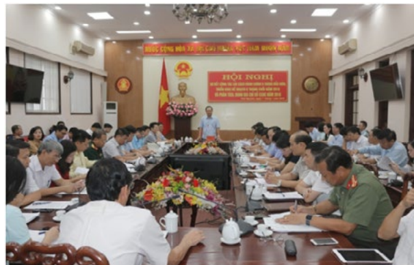
Đồng chí Nhữ Văn Tâm, Phó Chủ tịch thường trực UBND tỉnh chủ trì Hội nghị

chí được cải thiện như: Cải cách TTHC, cải cách tổ chức bộ máy hành chính, cải cách tài chính công.